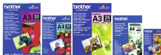
BP71GA3 BP71GA4 BP60MA3 BP60MA BP71GP