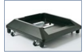
Unité stabilisatrice (SB-7100) recommandée à partir de 2 LT-7100 supplémentaires