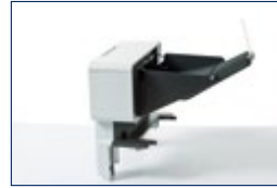
Bac de sortie (MX-7100) jusqu'à 500 pages (maximum 1)