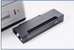
Cartouche d'encre de recharge (HC-05BK) environ 30'000 pages 1