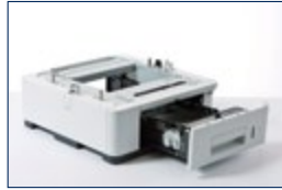
Bac à papier (LT-7100) jusqu'à 500 pages (maximum 3)